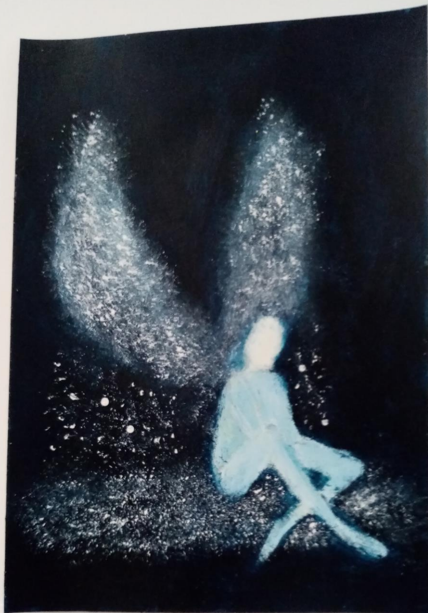
Luna stojaković, Grob bajadere