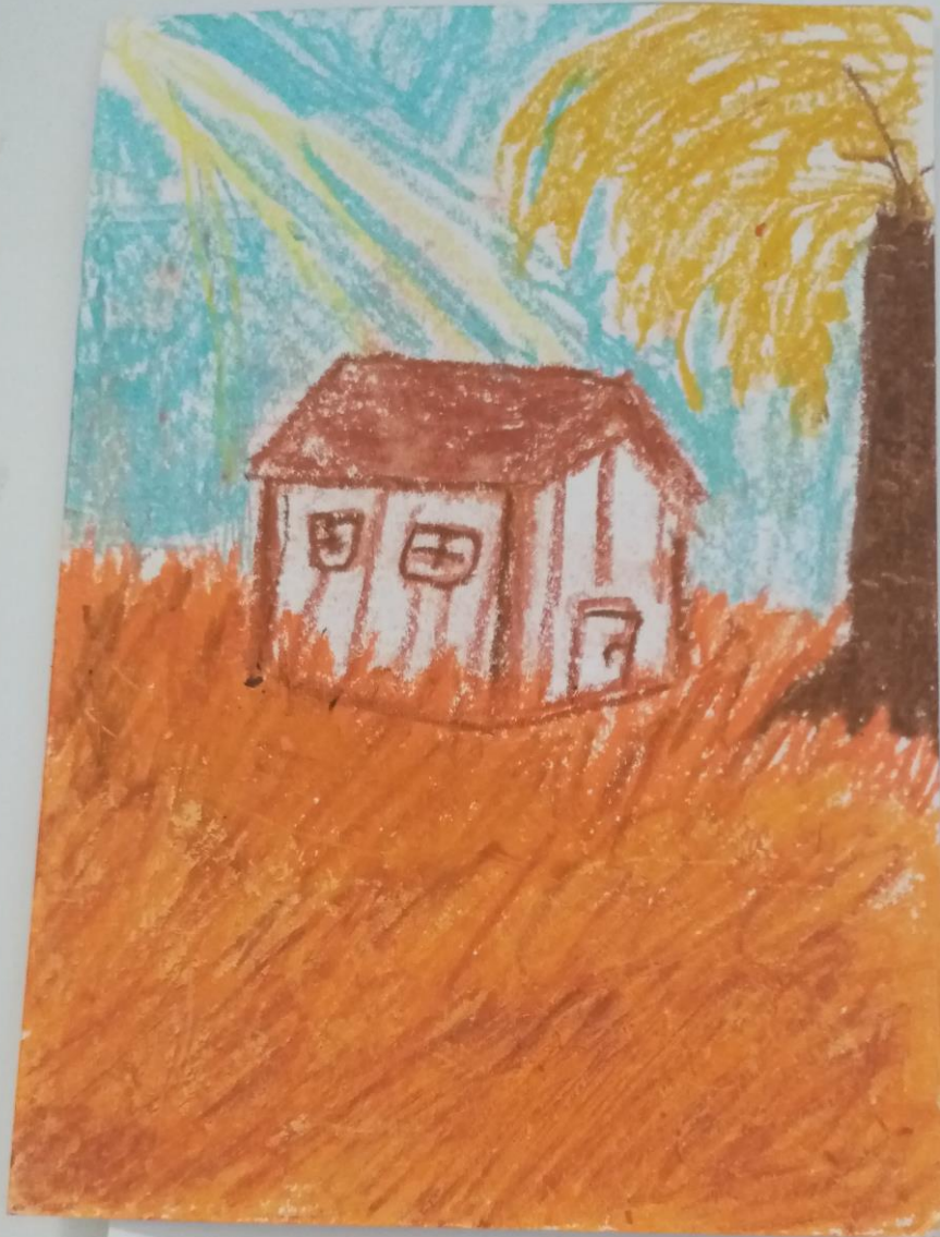
Ida Galetić, Jesenje večer