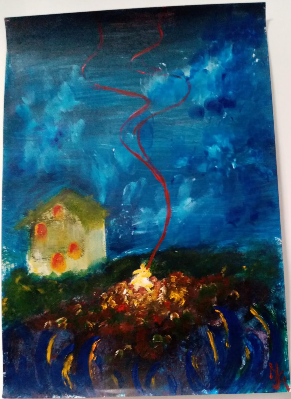
Mara Cvitanović, Notturmo