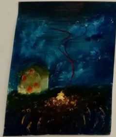
Mara Cvitanović, Nocturno