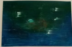
Tonka Šerbec, Dva mrena